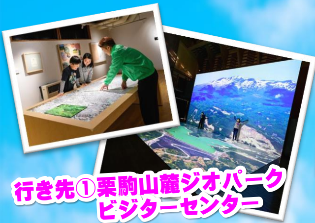
行き先① 栗駒山麓ジオパーク ビジターセンター