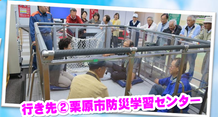
行き先② 栗原市防災学習センター