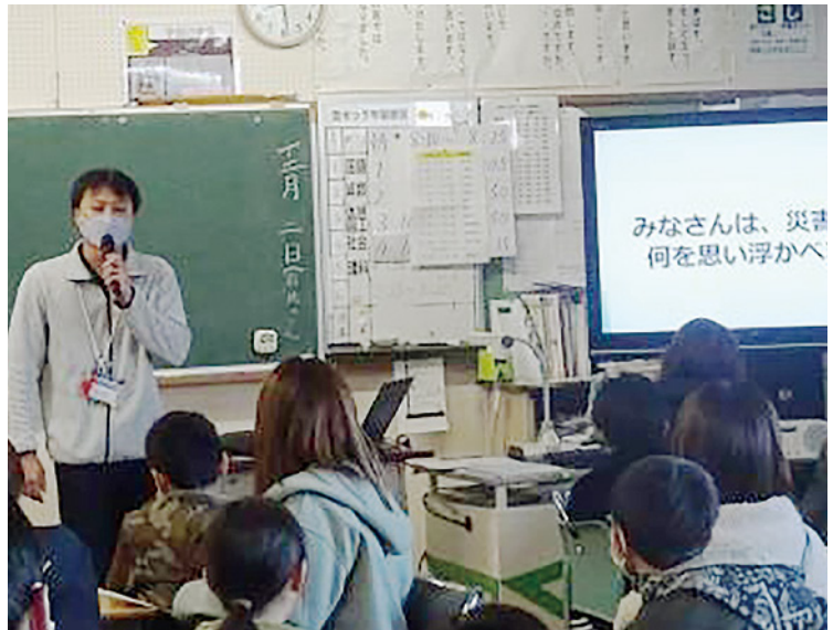
▲自分で守ろう自分の命

クロスロードゲームとは:災害時にどのような判断をするのか、判断はどうだったかを考えるゲーム。