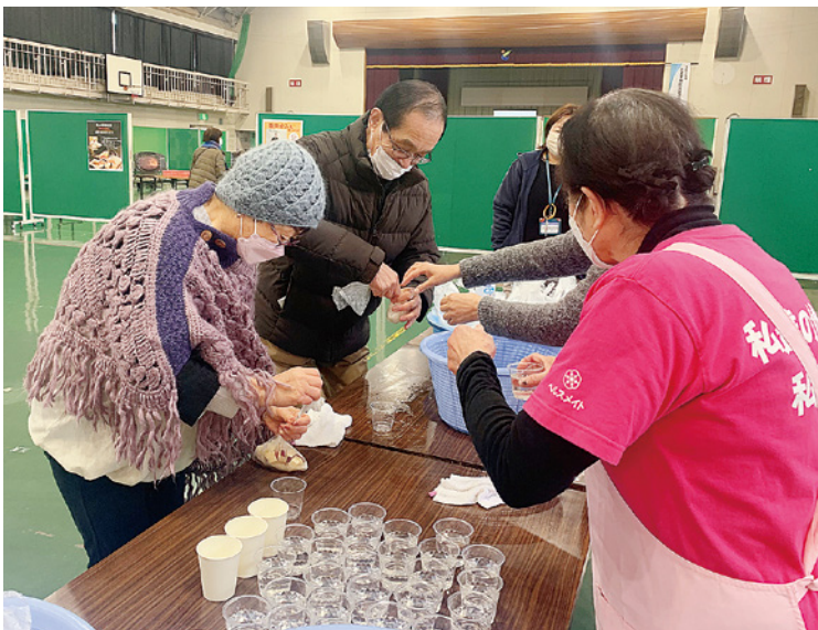
▲パッククッキングを体験