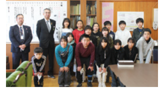
▲佐沼小学校の児童、先生方、保護者の方等約700名の方から集まった募金をお寄せいただきました。

「能登半島義援金」募集については、引き続き受付をしております。(問い合わせ先：登米市社会福祉協議会 本部) 石川県共同募金会 「令和6年1月4日～同年12月27日」まで 【TEL：0220-21-6310】