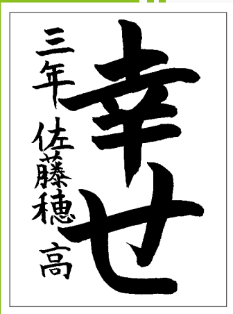
令和5年度福祉ふれあい作品コンクール 書道 小学校下学年の部 『最優秀賞』 浅水小学校