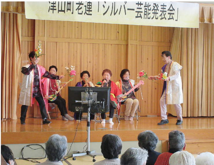
▲「河内おとこ節」を踊りと一緒に熱唱！