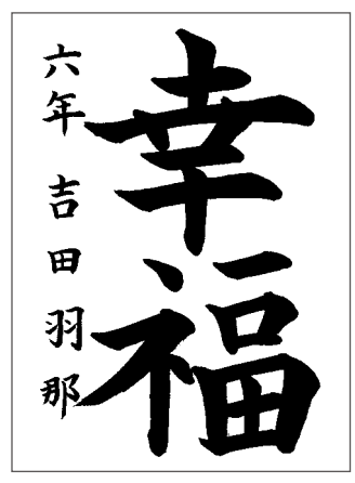
令和5年度福祉ふれあい作品コンクール 書道 小学校上学年の部 『最優秀賞』 佐沼小学校