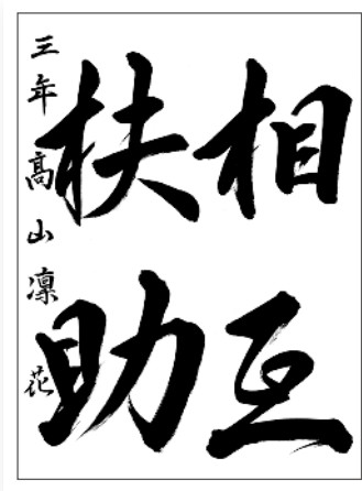
令和5年度福祉ふれあい作品コンクール 書道 中学校の部 『最優秀賞』 新田中学校