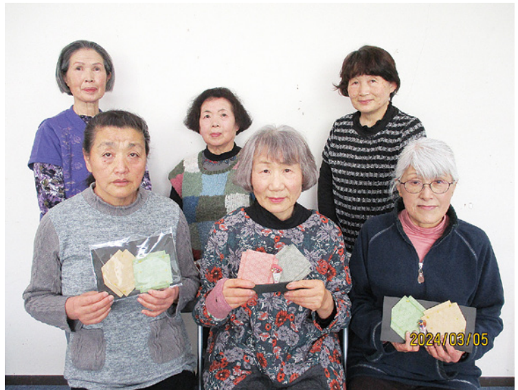
▲ひとつひとつ丁寧に作りました。