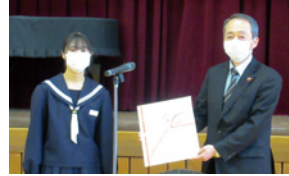
▲津山中学校の生徒、先生方から集まった募金を贈呈セレモニーにてお寄せいただきました。

皆さまの温かいご支援、ご協力に感謝申し上げますとともに、被災地の一日も早い復興を心よりお祈り申し上げます。