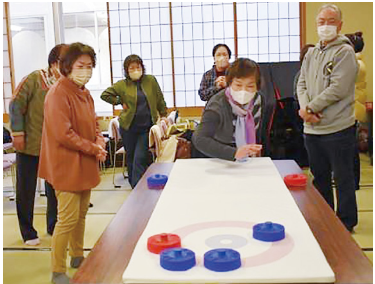
▲赤・青チームでスロットカーリング