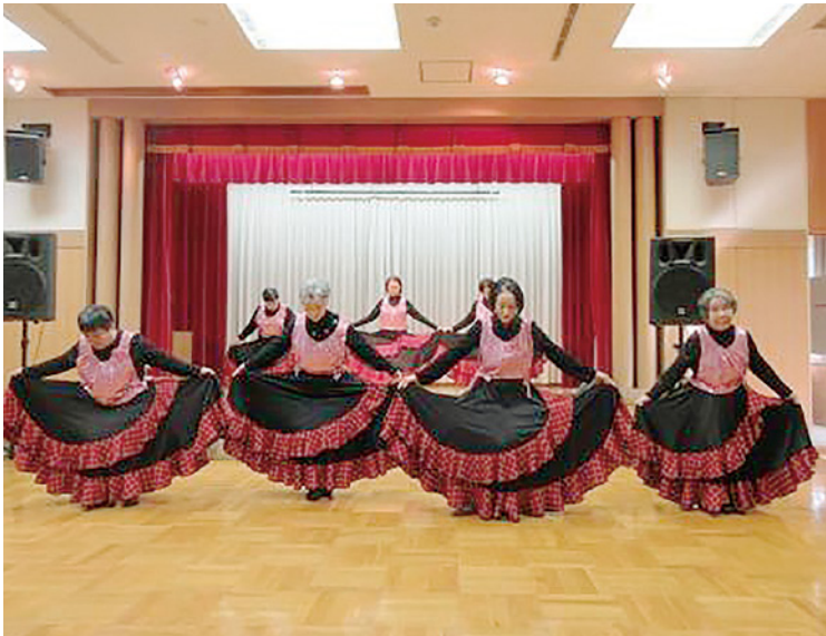
▲つなぐれ！広まれ！ボランティア