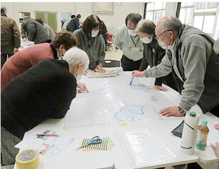
▲実際の行政区の地図を用いて作成