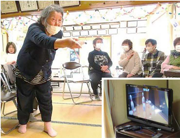
▲昔の感覚思い出したよー!!