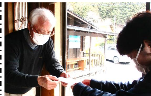
▲東和町ボランティア友の会様より5万円の寄付をいただきました。