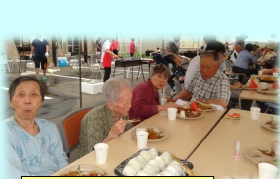
おにぎり、焼肉に満足！！

ご家族や地域のボランティアの皆様にご参加・ご協力いただき大成功。皆様、ありがとうございました！！ 天候に恵まれ、おいしい焼き肉・スイカなど、入居者の方々もいつもよりたくさん召し上がりました。「外で食べるとおいしいね」「楽しかったね～」「またやりたいね」と笑顔で喜ばれておりました。とても楽しい時間を過ごされました。