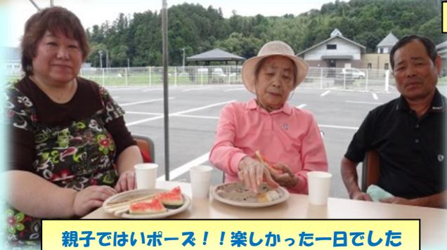
親子ではいポーズ！！楽しかった一日でした