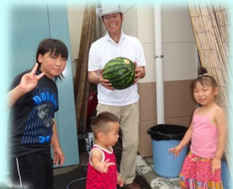
子ども達も大きなスイカに興奮