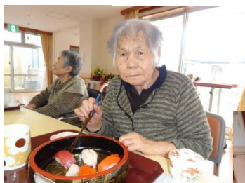
とっても美味しいね！

風の路では、本物に触れるという事を大切にしております。その一環として6月のある日、本職のお寿司屋さんが風の路に出張され、入居者の方々の目の前でお寿司を握り腕前を披露していただきました。出来上がったお寿司はそれぞれの寿司鉢に盛り堪能しました。入居者・ショート利用の皆さん共々大変喜び「美味しいねー」、「たまにはいいね」と感激でした。またおいで下さる事を楽しみにしております。