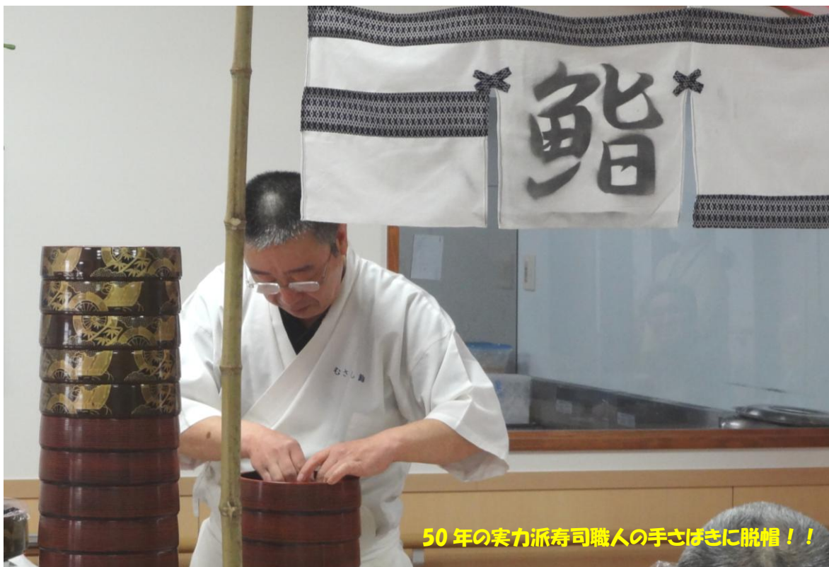
50年の実力派寿司職人の手さばきに脱帽！！

風の路では、本物に触れるという事を大切にしております。その一環として6月のある日、本職のお寿司屋さんが風の路に出張され、入居者の方々の目の前でお寿司を握り腕前を披露していただきました。出来上がったお寿司はそれぞれの寿司鉢に盛り堪能しました。入居者・ショート利用の皆さん共々大変喜び「美味しいねー」、「たまにはいいね」と感激でした。またおいで下さる事を楽しみにしております。