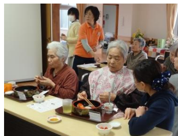
「本物はやっぱりちがうねー」と満足気の皆さん