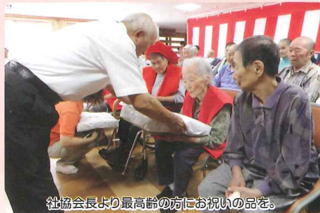
社協会長より最高齢の方にお祝いの品を。

9月15日に第2回長寿を祝う会を開催いたしました。風の路に入居されている長寿の方を代表して90歳を超えた4名の方に記念品をお渡ししたあと、入居者代表の方に「あんときゃどしゃぶり」と「祝い酒」を熱唱していただき会場が和みました。皆さんの前で得意な事を披露することは気分爽快になり長寿の秘訣にもなります。地域の皆さんの支えと、入居者の方々の介護を通して幸せを感じることのできる会でした。