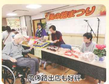
風の路出店も好評