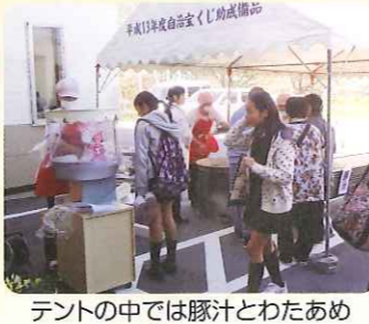
テントの中では豚汁とわたあめ