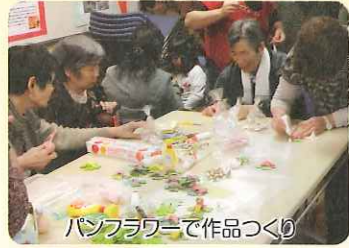
パンフオーで作品づくり