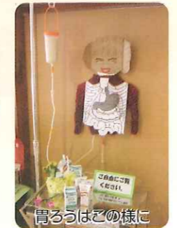
胃ろうはこの様に

地域の皆様を支えられて一年が過ぎました。これからも「きすな」を深めて参りますのでご支援とご協力をお願いします。