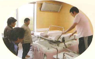
特殊浴槽の操作に耳を傾けて