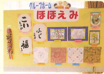
グループホームほほえみも参加して