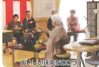
おいしい抹茶を味わって