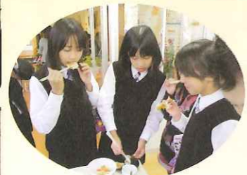
残りご飯利用の焼きせんべいが人気