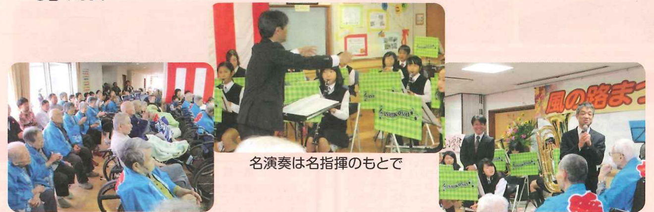
熱心に聞き入る皆さん

11月3日「第2回風の路祭り」が開催されました。当日はボランティアとして地域の茶道教室、パンフラワー教室の皆様、石越小学校の児童、保護者の皆様のご協力により、今年度「宮城県吹奏楽コンクール地区大会金賞受賞」のプラスバンド部総勢30名の演奏に、会場の皆さんはその音色に酔いしれ沢山の感動をいただきました。お楽しみコーナーでは、厨房からのたこ焼き、焼きそば、豚汁をいただき、初めての金魚すくいでは入居者の皆さんが「懐かしいね～」と楽しみました。すくった金魚は各ユニットで大切に飼いはじめ、「餌やったべが」と新しい仲間の成長を見守る日々です。