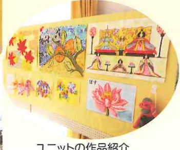
ユニットの作品紹介