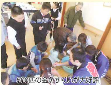
500匹の金魚すくいが大好評