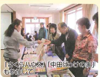
「さくらハウス」「中田はっけの家」も参加して