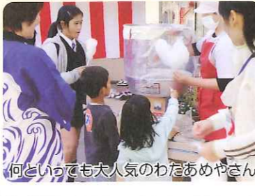
何とんでも大人気のわたあめやさん