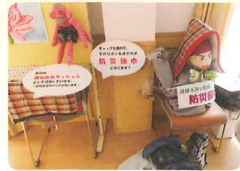
イスが防災頭巾に変身