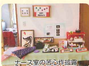
ナース室の苦心作披露