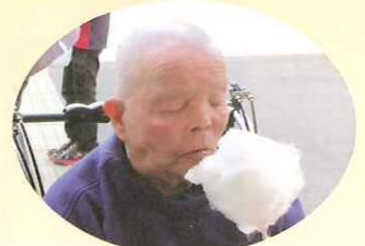
おいしいわたあめに満足