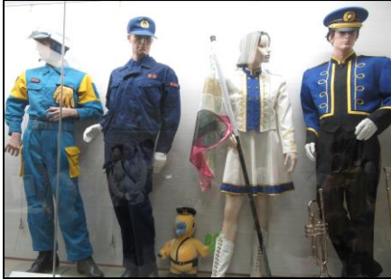
『警察官の制服や持ち物が 展示されていました。』