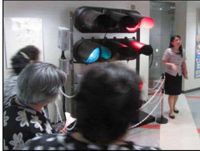
『今の信号機はライトがLED Dになってるんだね・・・』

8月25日(木)、南天の会で宮城県警本部に行き、110番を受理する通信指令室、信号機をコントロールしている交通管制センターを見学させていただきました。県内の事件事故の発生状況や交通事故や交通渋滞など全て管理されており、事件・事故を素早く解決する仕組みを知ることができました。