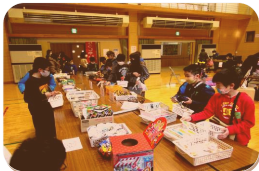
くじ引きコーナー、当たったかな?