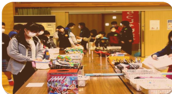
さかな釣りゲーム がんばれ!